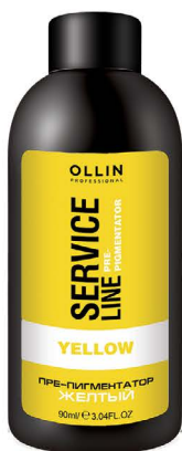
YELLOW FLUID-PRE-COLOR Флюид-препигментатор желтый, 90 мл