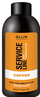
COPPER FLUID-PRE-COLOR Флюид-препигментатор медный, 90 мл