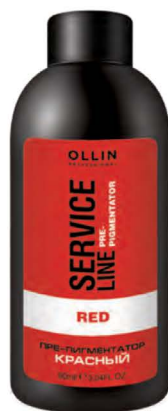
RED FLUID-PRE-COLOR Флюид-препигментатор красный, 90 мл